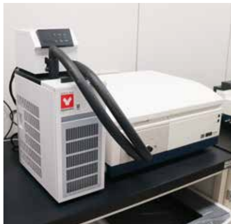
蛍光光度計 組合せ例